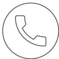
Hands-free mit CallControl