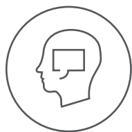
Own Voice Processing 2.0

Bei einer eindrucksvollen Sound-Demonstration am Signia Messestand konnten wir selbst Reinhören, die AX funktioniert: Dank der innovativen 2-Wege-Signalverarbeitung von Signia und Own Voice Processing 2.0 erkennen die Hörgeräte die Stimme des Hörgerätetragenden – und verarbeiten diese ge-