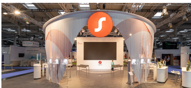
Signia Stand auf dem EUHA-Kongress 2022

Die Technik um uns herum entwickelt sich rasant – selbst die kleinsten Geräte sind mittlerweile mit größter und modernster Chip-Technologie ausgestattet. Das gilt auch für Hörgeräte. Um auf dem Laufenden zu bleiben und aktuelle Trends und Entwicklungen im Blick zu behalten, sind wir für Sie ständig unterwegs, zum Beispiel auf Vorträgen und Messen. Die größte internationale Fachveranstaltung für Hörakustik ist der EUHA-Kongress, der vom 12. – 14. Oktober in Hannover stattfand und tausende AkustikerInnen, Hörgeräte-HerstellerInnen und WissenschaftlerInnen aus mehr als 90 Ländern zusammenbrachte.